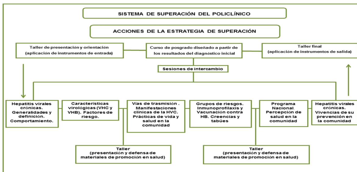
Fig. 2. Flujoograma de las acciones de superación